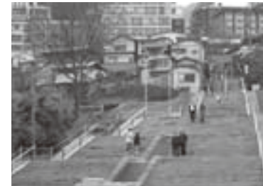
関屋橋から見た延伸された石段

伊香保温泉再生事業は配湯施設や道路整備、石段延長やそのための観山荘買収や解体費用等で、第1期・2期で総事業費34億円が投資されます。H22年度から第2期計画が始まっています。