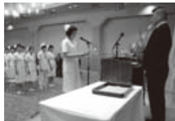
渋川准看護学校の卒業式・閉校式 私も出席させていただきました

渋川総合病院でも看護師不足対策は緊急の課題であり、市内の病院・介護施設でも毎週のように求人が出ています。その状況を打開するためにも、渋川市も積極的に動くべきと考え、昨年9月定例議会において看護学校への運営費助成や学生への奨学金制度を創設することを提言しました。県からの運営費補助や奨学金制度充実に向けても取り組んでいきます。