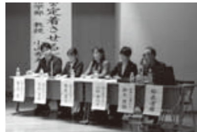
介護現場の経験を活かし パネリストとして講演会に参加

施設入所の希望者は年々増え、特別養護老人ホームの入所待機者は400人以上にもなります。市の介護保険財政の適正な運営を考えながら、入所施設整備を進めていく必要があります。ケアマネージャーとしての専門性と高齢者福祉の現場での経験を活かし、安心して暮らせる老後のために全力で取り組んでいきます。