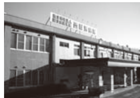
移転となるのか 独立行政法人 西群馬病院

この協力体制ができない限り、西群馬病院に渋川市が大規模な財政支出をすることは、市全体にとってプラスになりません。