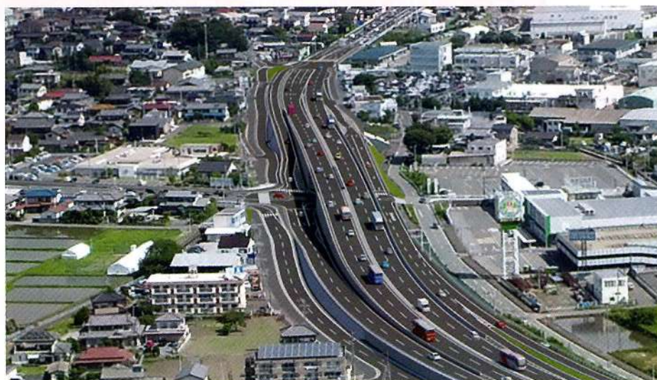
中村立体交差点イメージパース

国土交通省高崎河川国道事務所が中村交差点立体の概要を示しました(イメージパース参照)。