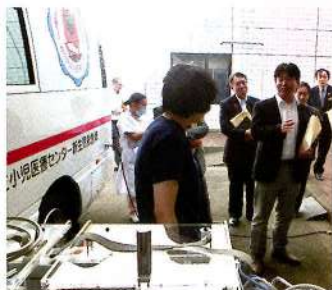
常任委員会での 医療センター視察

再整備マスタープランは2年間で策定し、通常10年かかると言われている病院建設は少しでも期間を短縮するとの答弁でした。プラン策定の予算は1,000万円です。